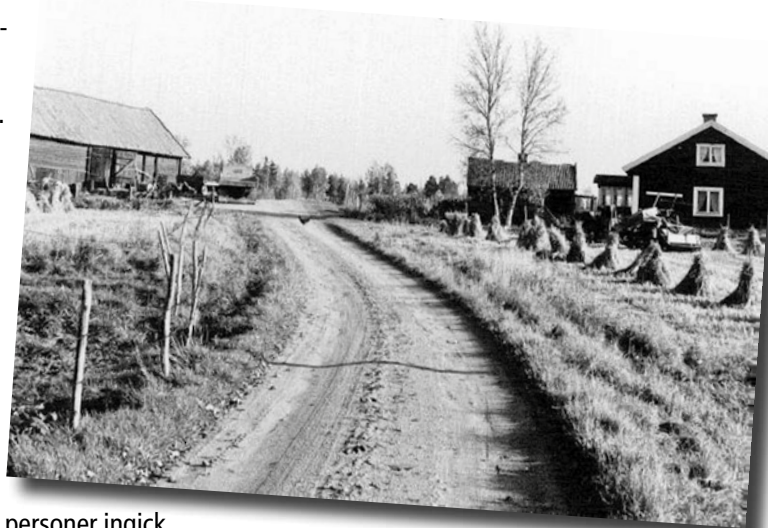
Myggdalen 1958.

Vid begravningen invigdes Tyresö kyrka av ärkebiskopen. Gabriel var bror till Axel Oxenstierna och Sveriges ledande personer ingick i bröllopsföljet, även drottning Kristina. På kvällen utbröt ett kraftigt oväder så hela följet fick inkvarteras över natten på slottet och i närliggande gårdar.