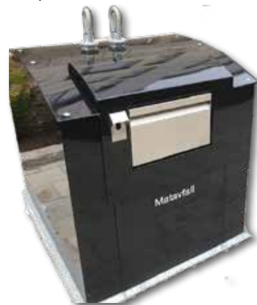
4 st matavfallsbehållare kommer att placeras längs lokalgatan. Du öppnar dem med din nyckelbricka