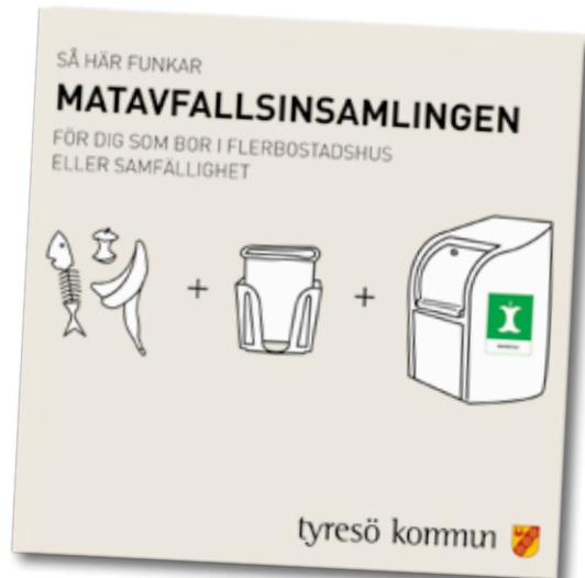
Informationsbroschyr från Tyresö kommun

Det finns 4 stycken gråsvarta kärl placerade längs lokalgatan. Du öppnar dem med din nyckeldricka. Kärlen töms på fredagar.