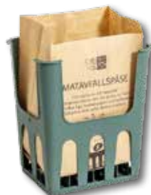
Matavfallspåse och påshållare